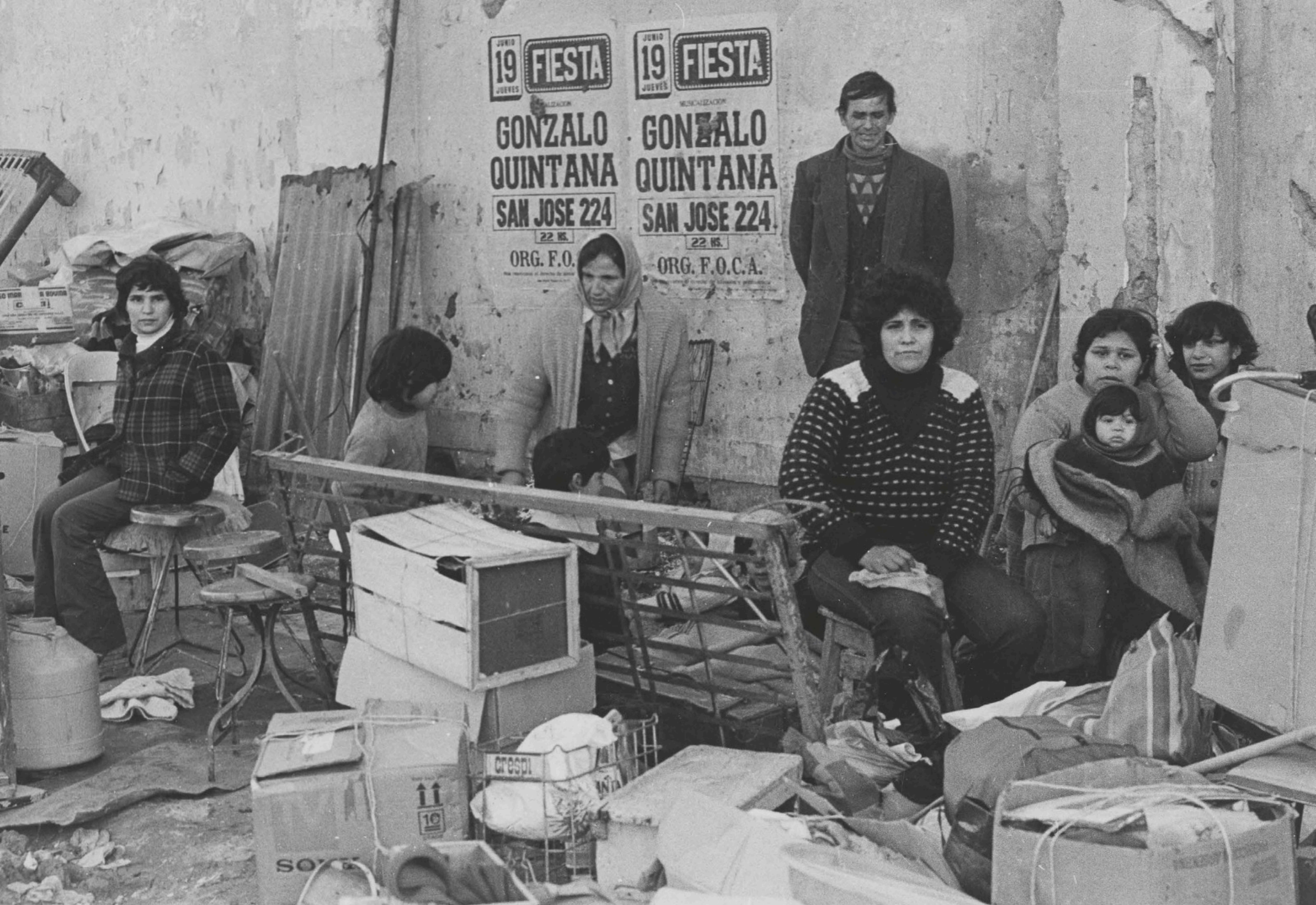
Desalojo forzoso de familias para la construcción de la autopista 25 de mayo. Buenos Aires, 1977