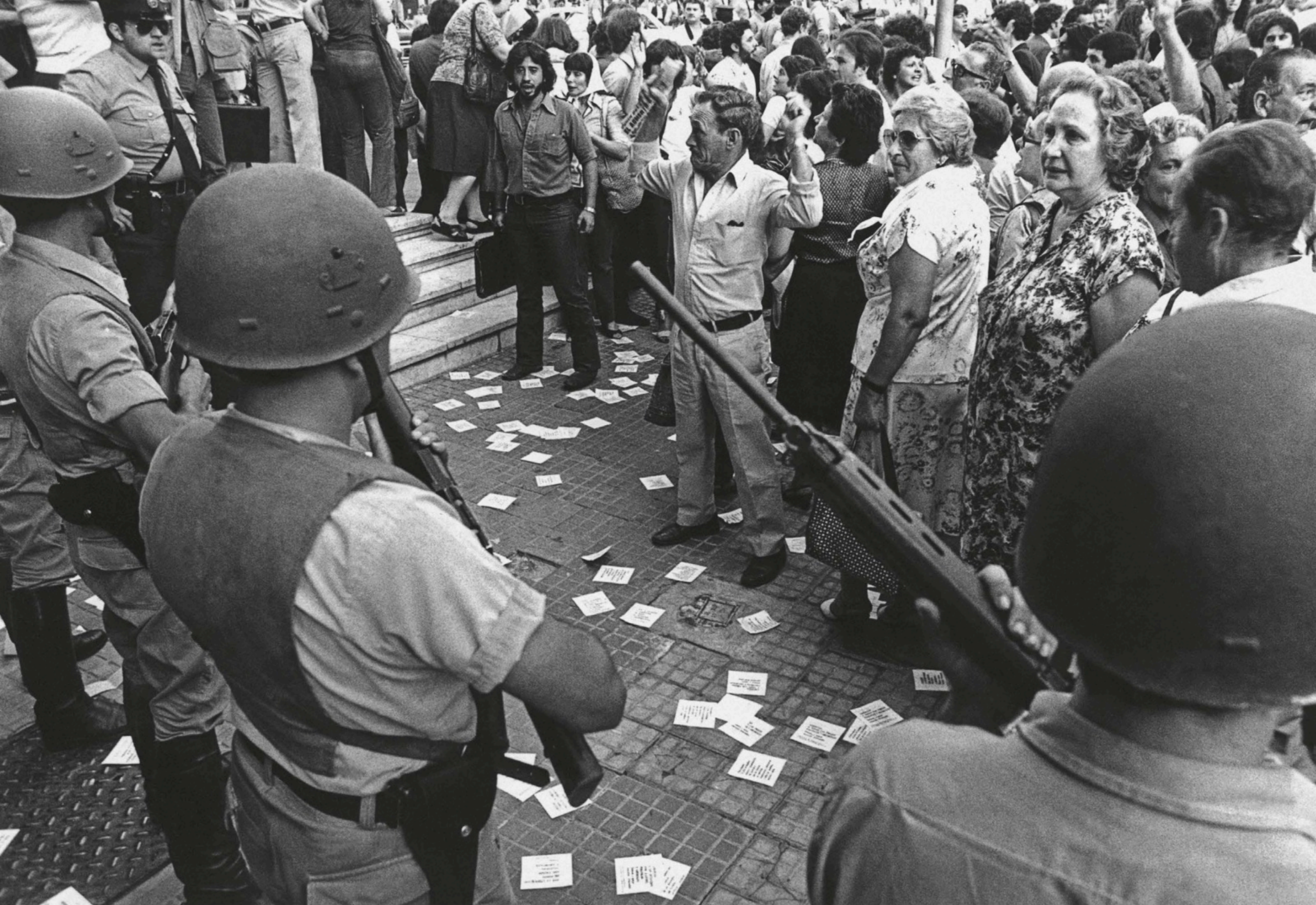
Marcha de organizaciones de derechos humanos. Buenos Aires, 1981.