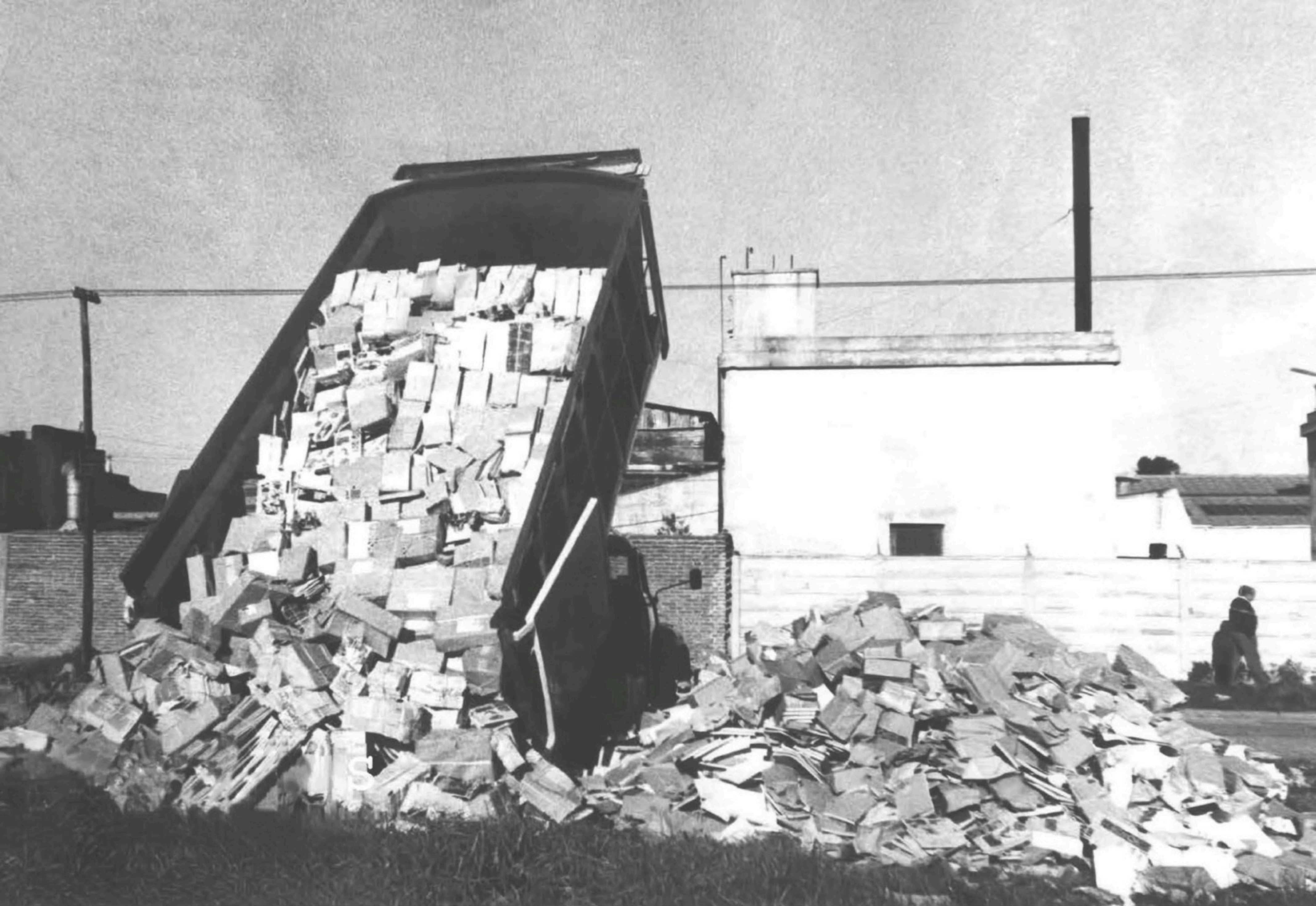
Secuestro y quema de libros prohibidos. Sarandí, 1980