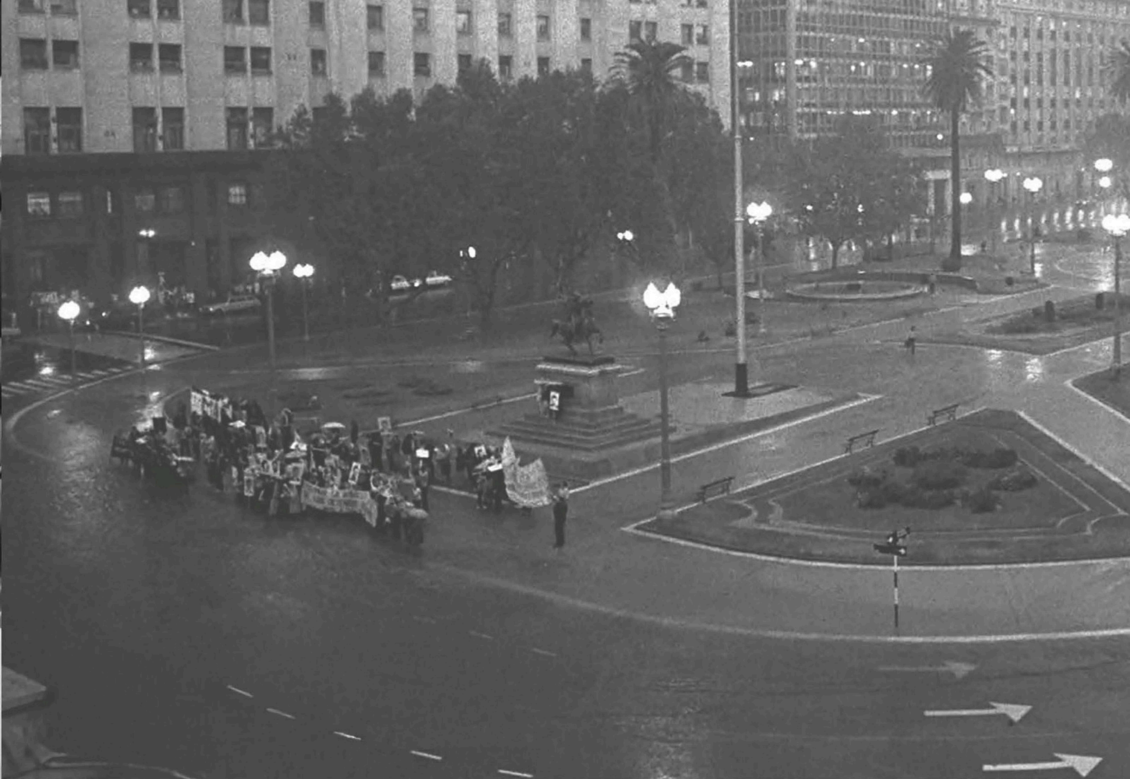
Marcha de organismos de derechos humanos en plaza de Mayo. Buenos Aires, 1978