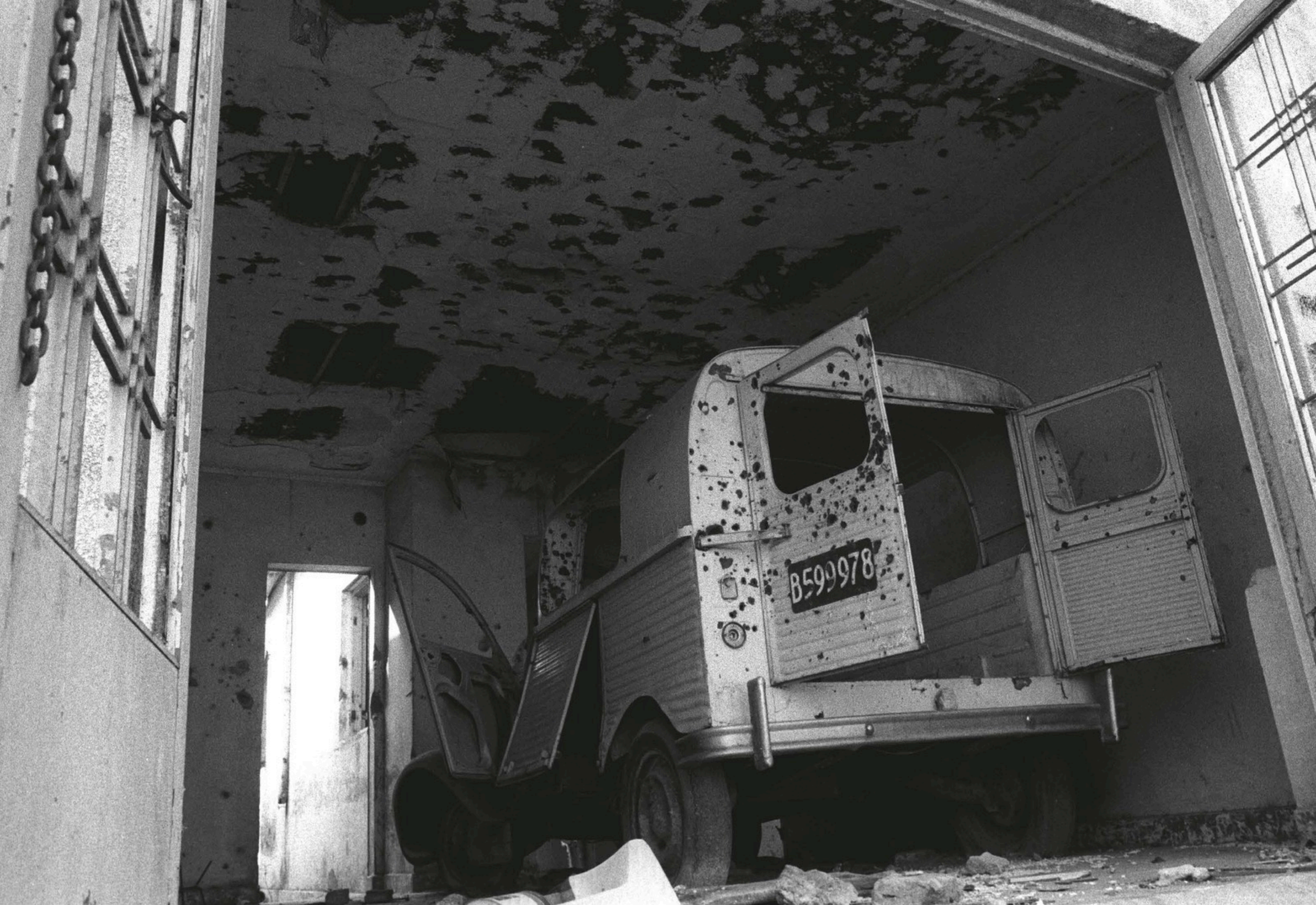
Represión a una casa de militantes, hoy sitio de memoria Casa Mariani Teruggi. La Plata, 1976