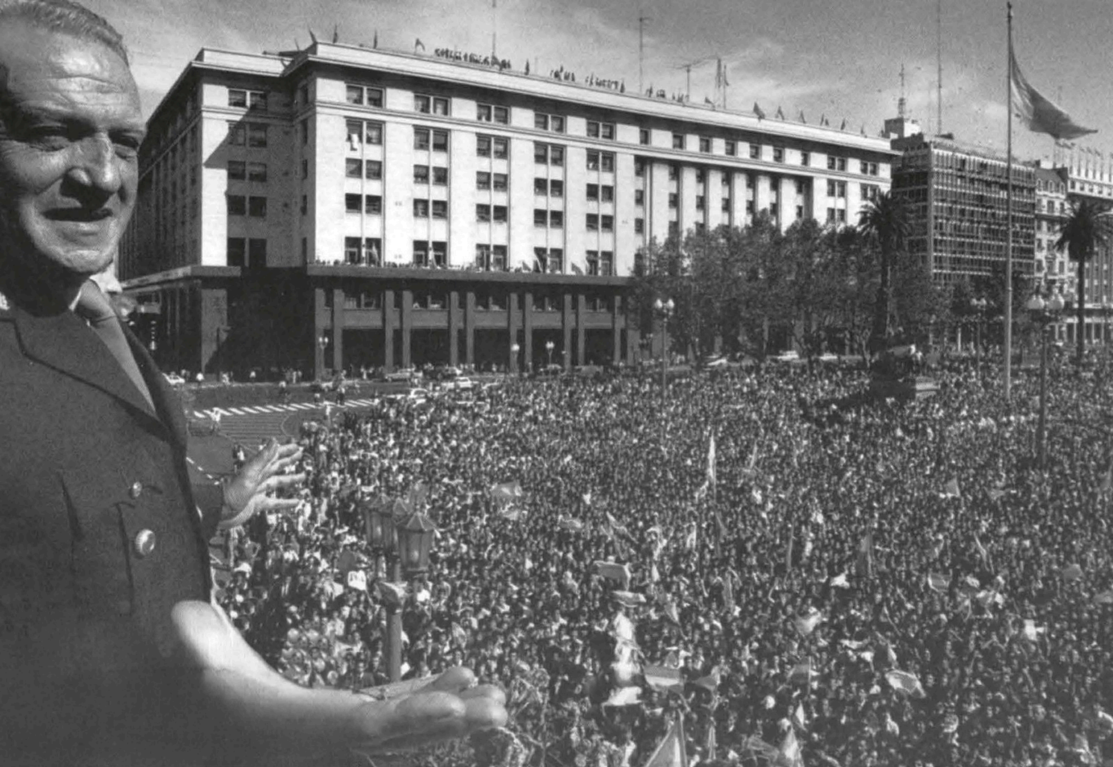
Fortunato Galtieri en plaza de mayo días después del inicio de la guerra de Malvinas. Buenos Aires, 1982