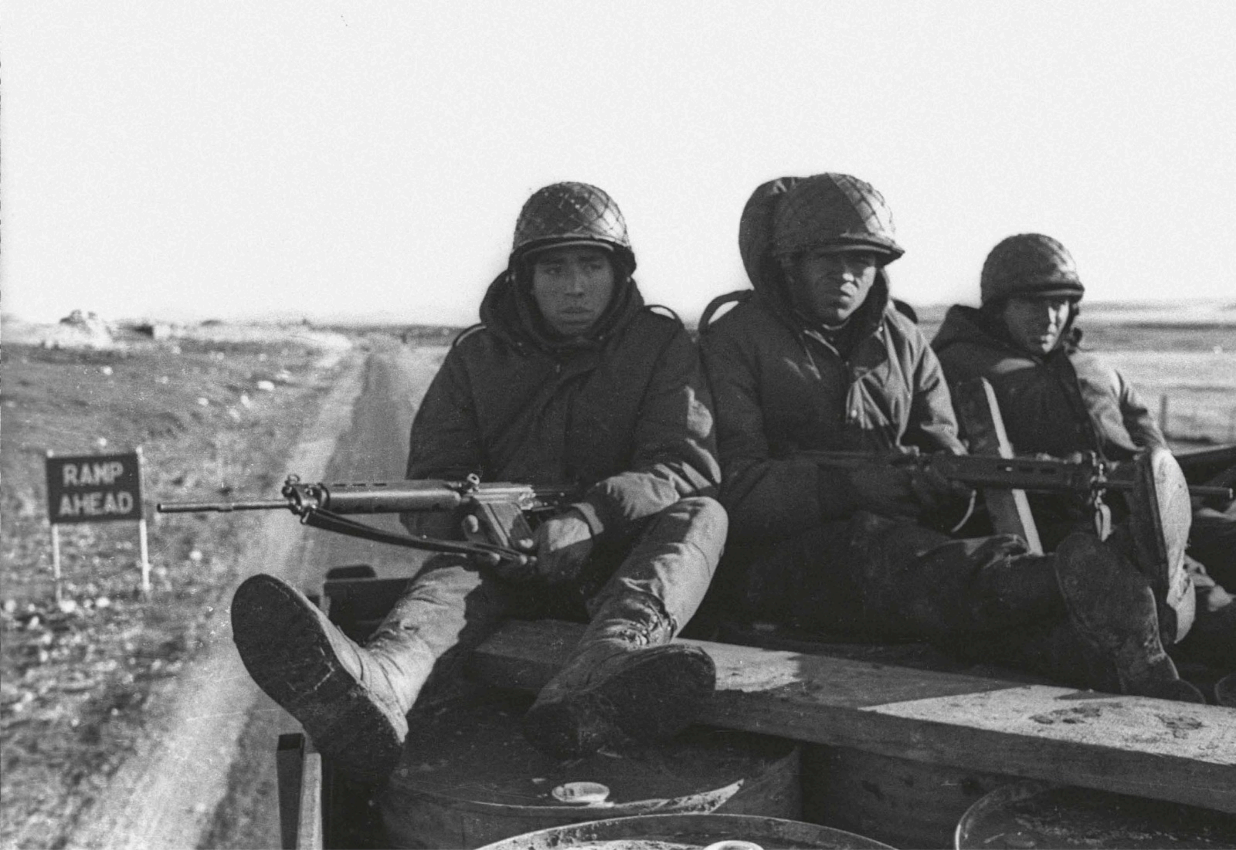
Soldados conscriptos en la Guerra de Malvinas. Islas Malvinas, 1982