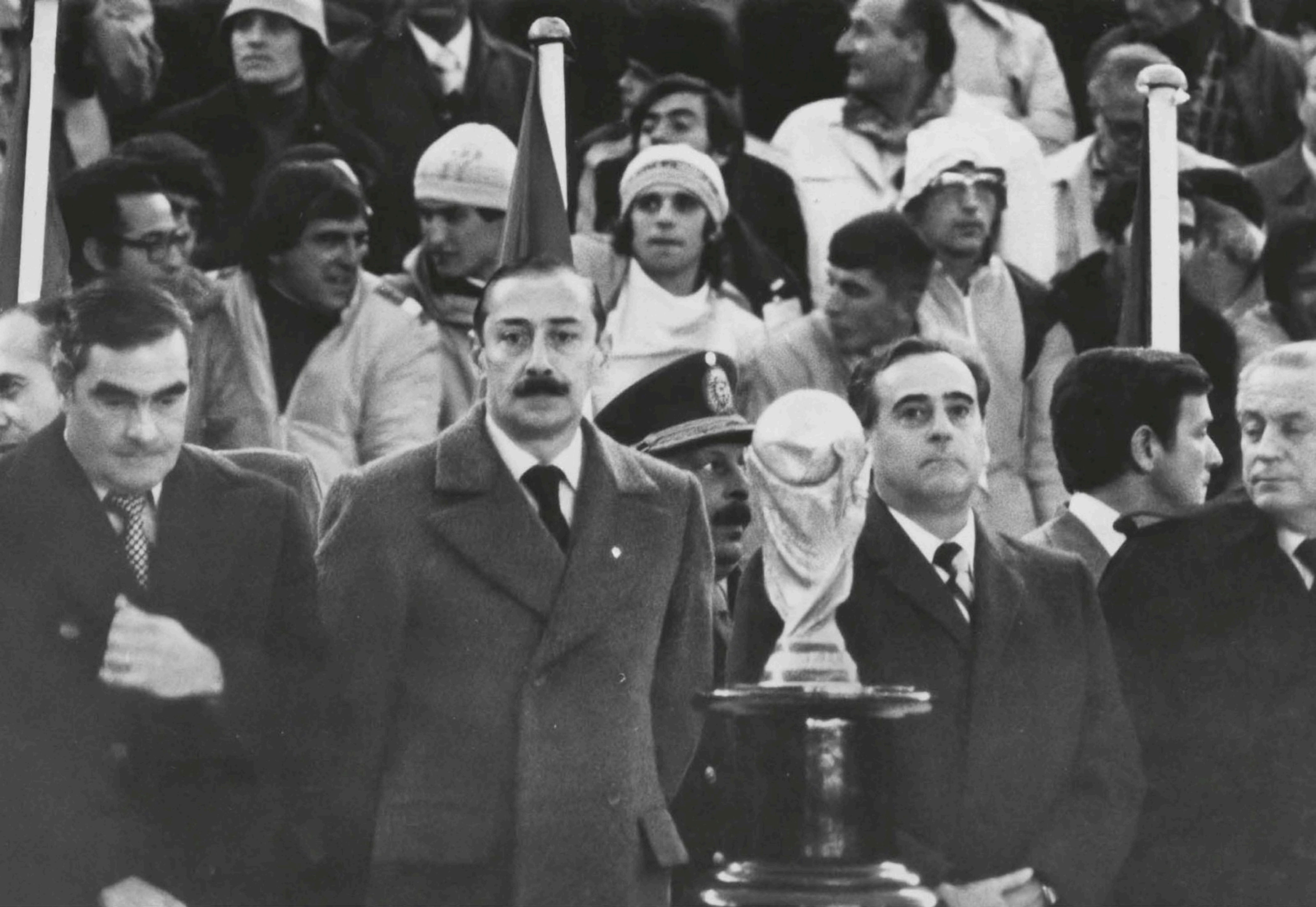
La copa del mundo, miembros de la Junta Militar y el presidente de la AFA. Buenos Aires, 1978