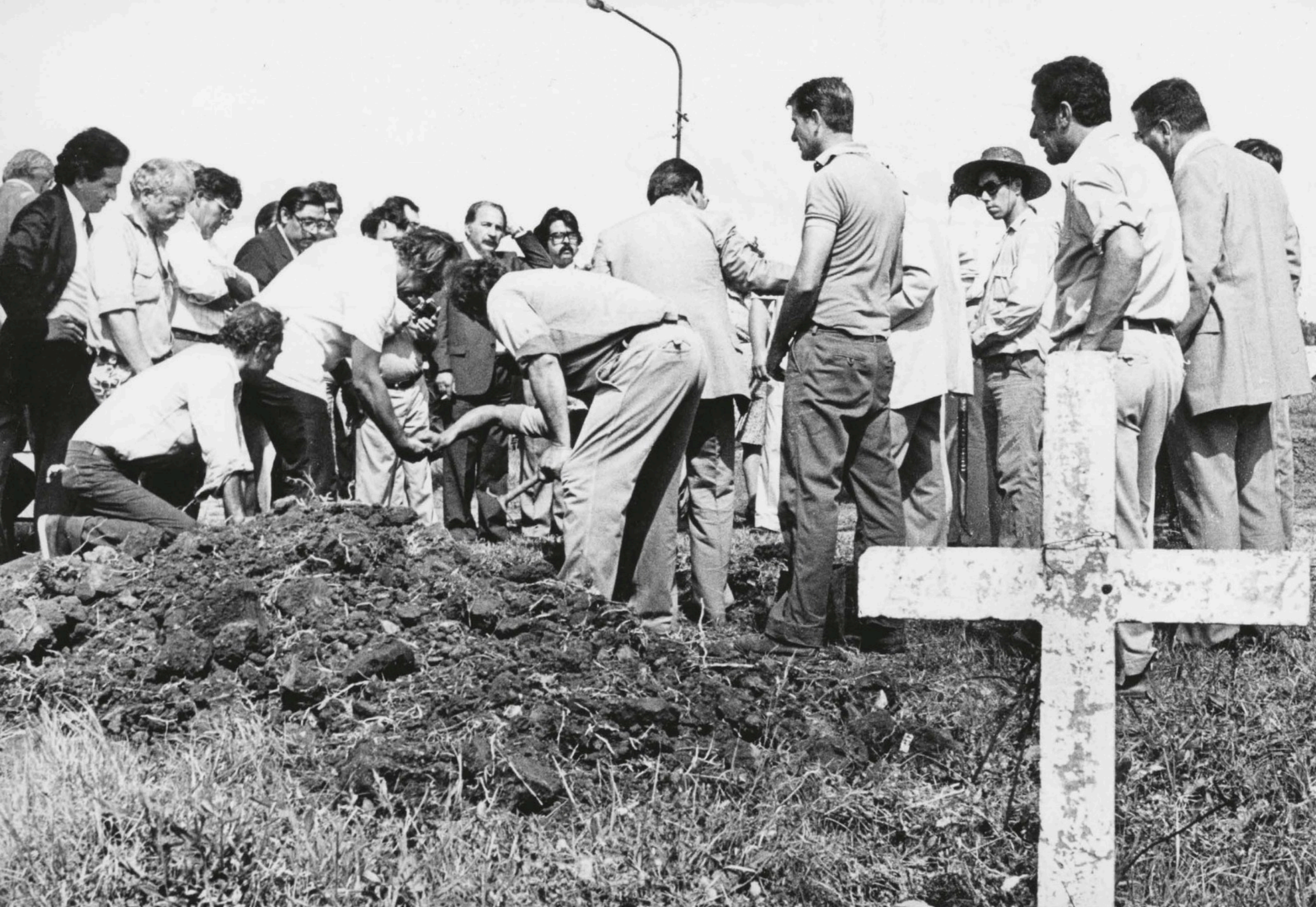
Tumbas NN del cementerio de Moreno. Buenos Aires, 1983.