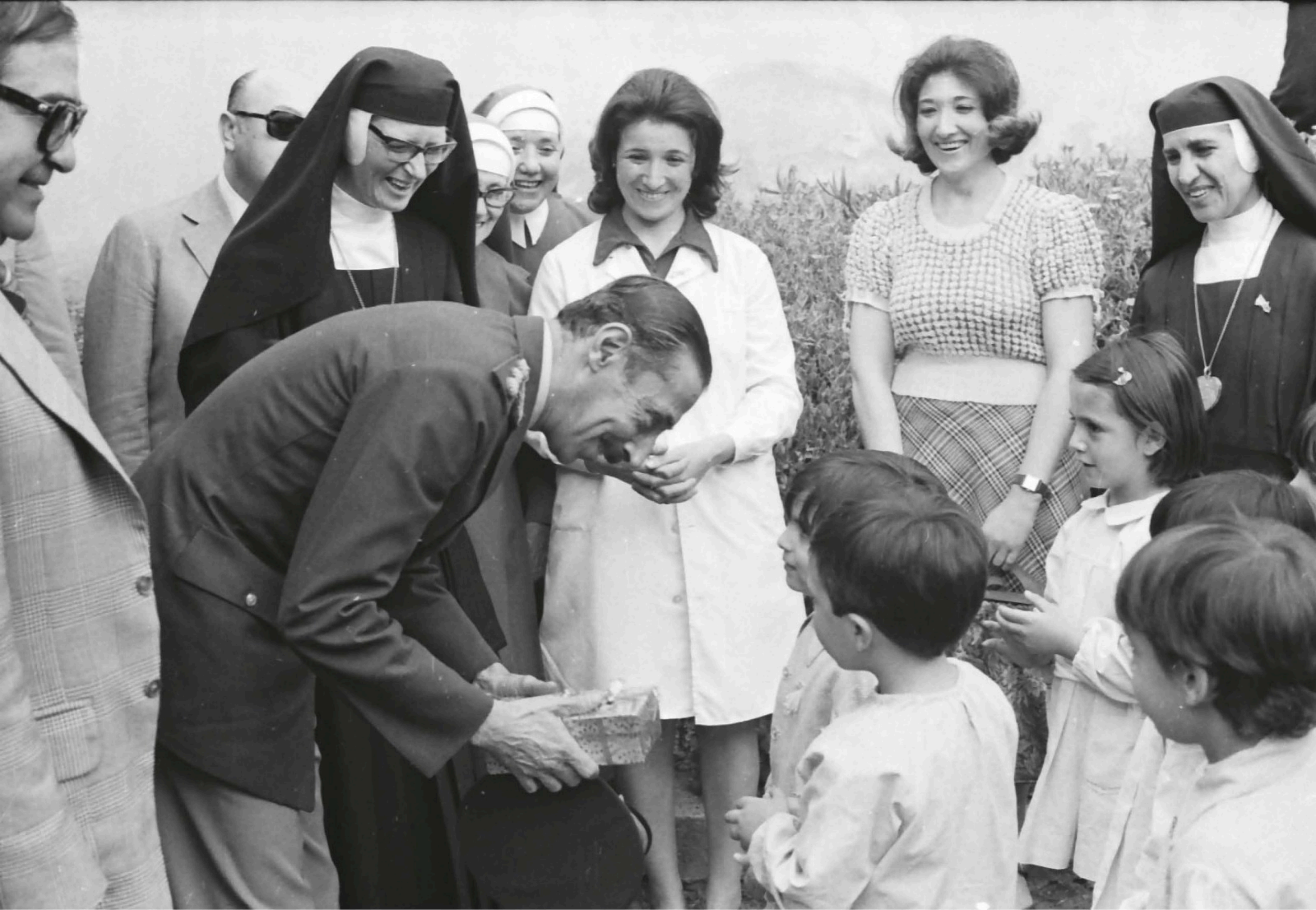
El dictador Jorge Rafael Videla en una escuela. Argentina, 1976.