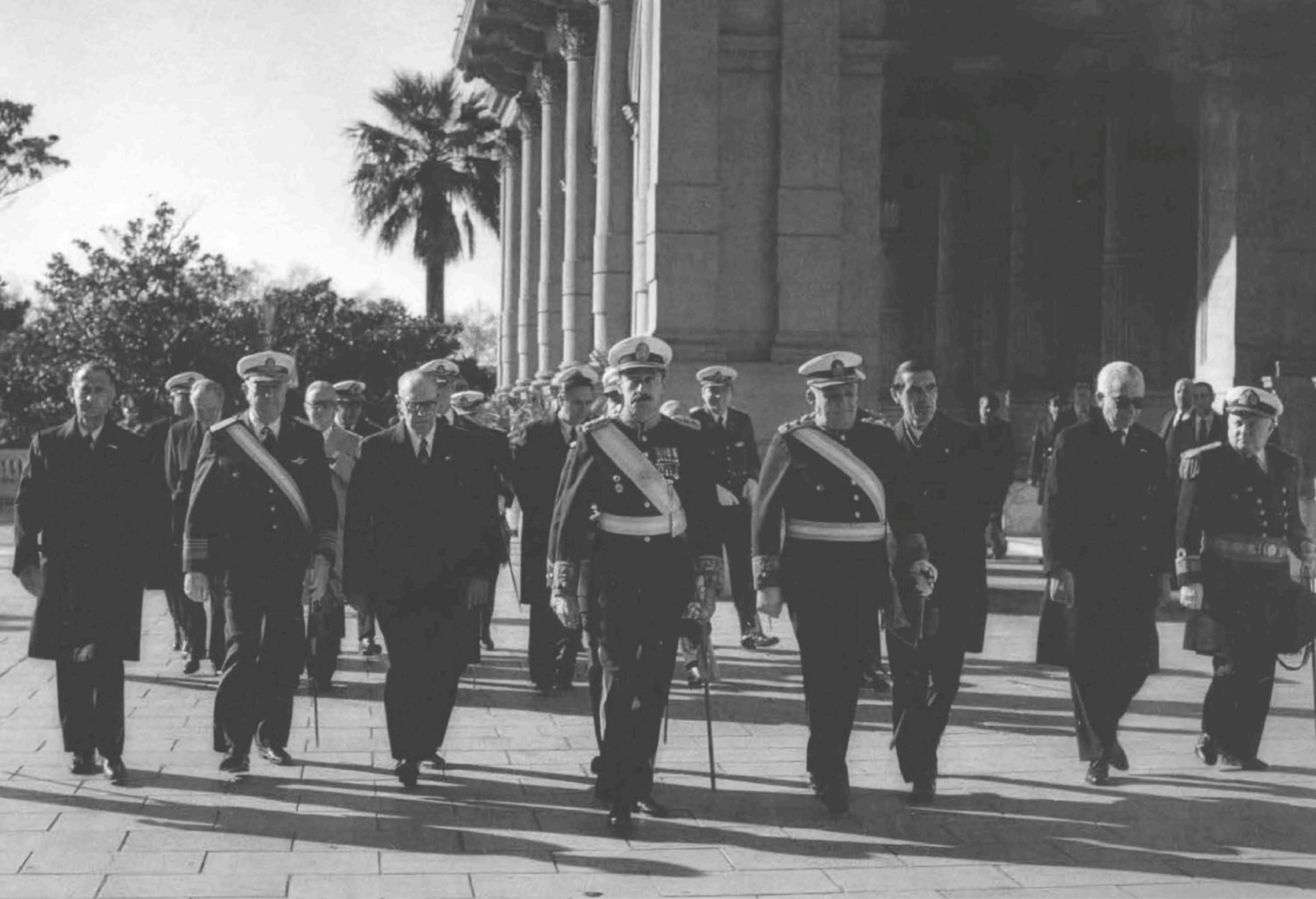
Jorge Rafael Videla y su gabinete camino a la catedral. Buenos Aires, 1976