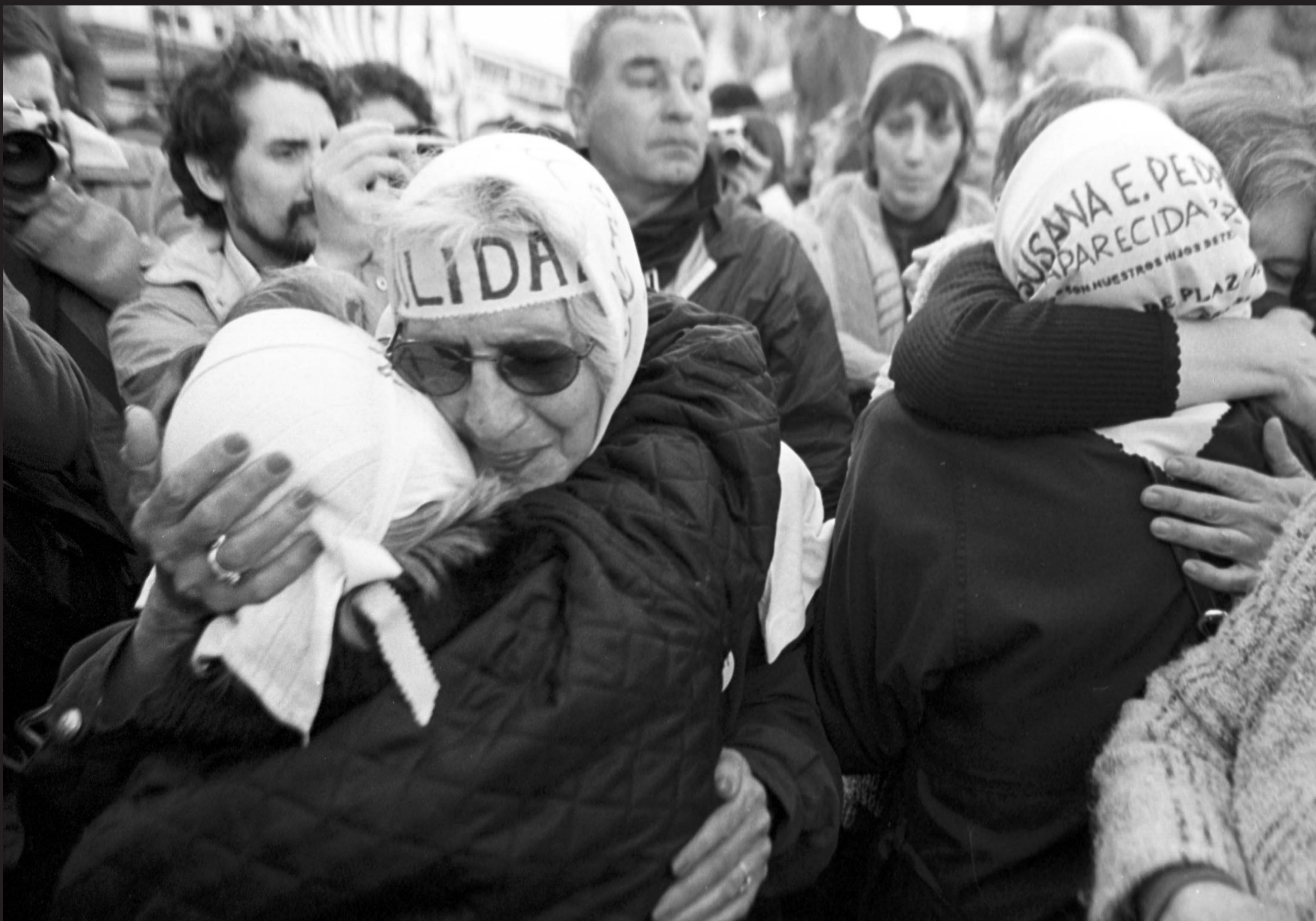
Nulidad de las leyes de Obediencia Debida y Punto Final. 12 de agosto de 2003.