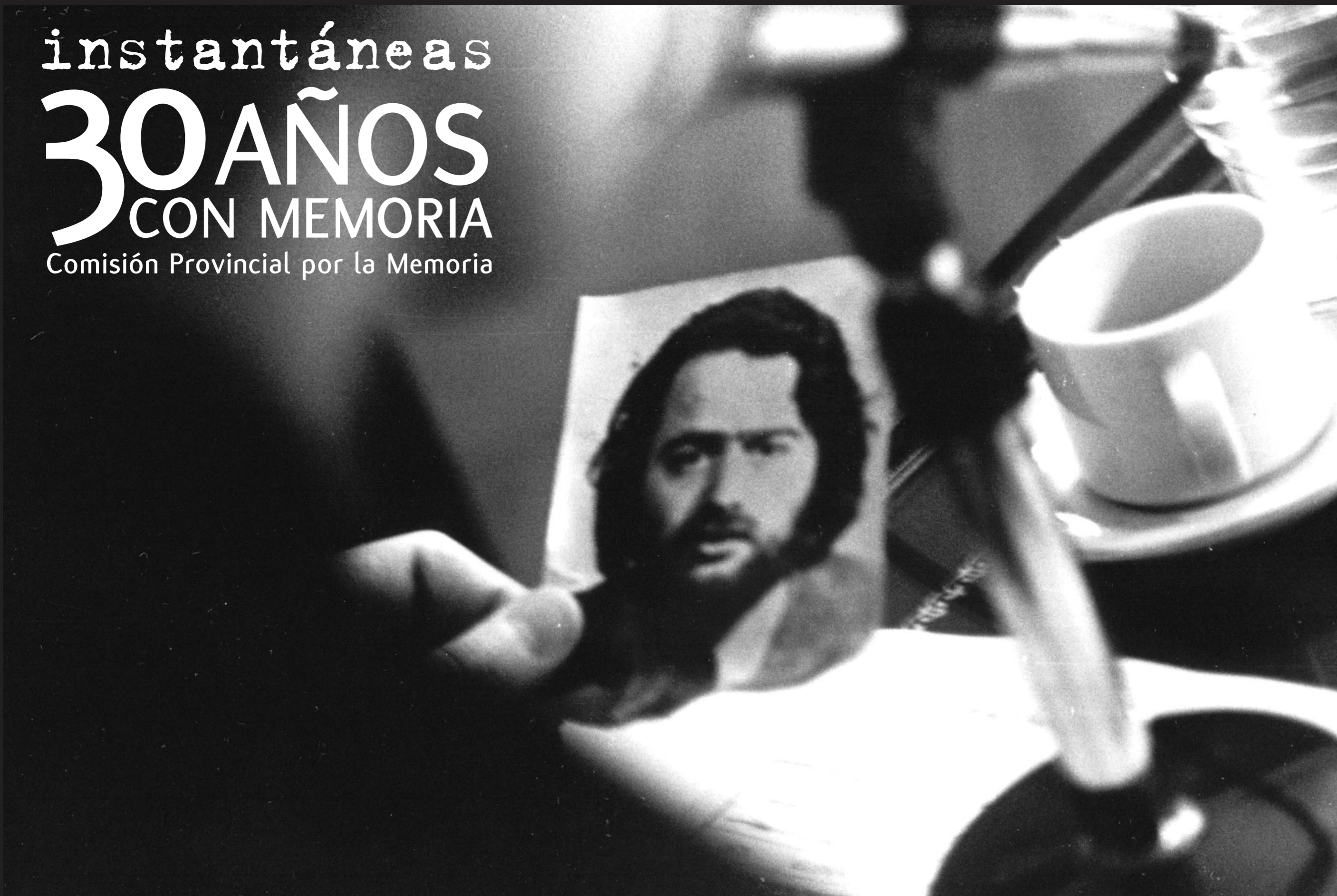
Juicios por la Verdad iniciados en el año 1998. Cámara Federal de La Plata. Año 2002.