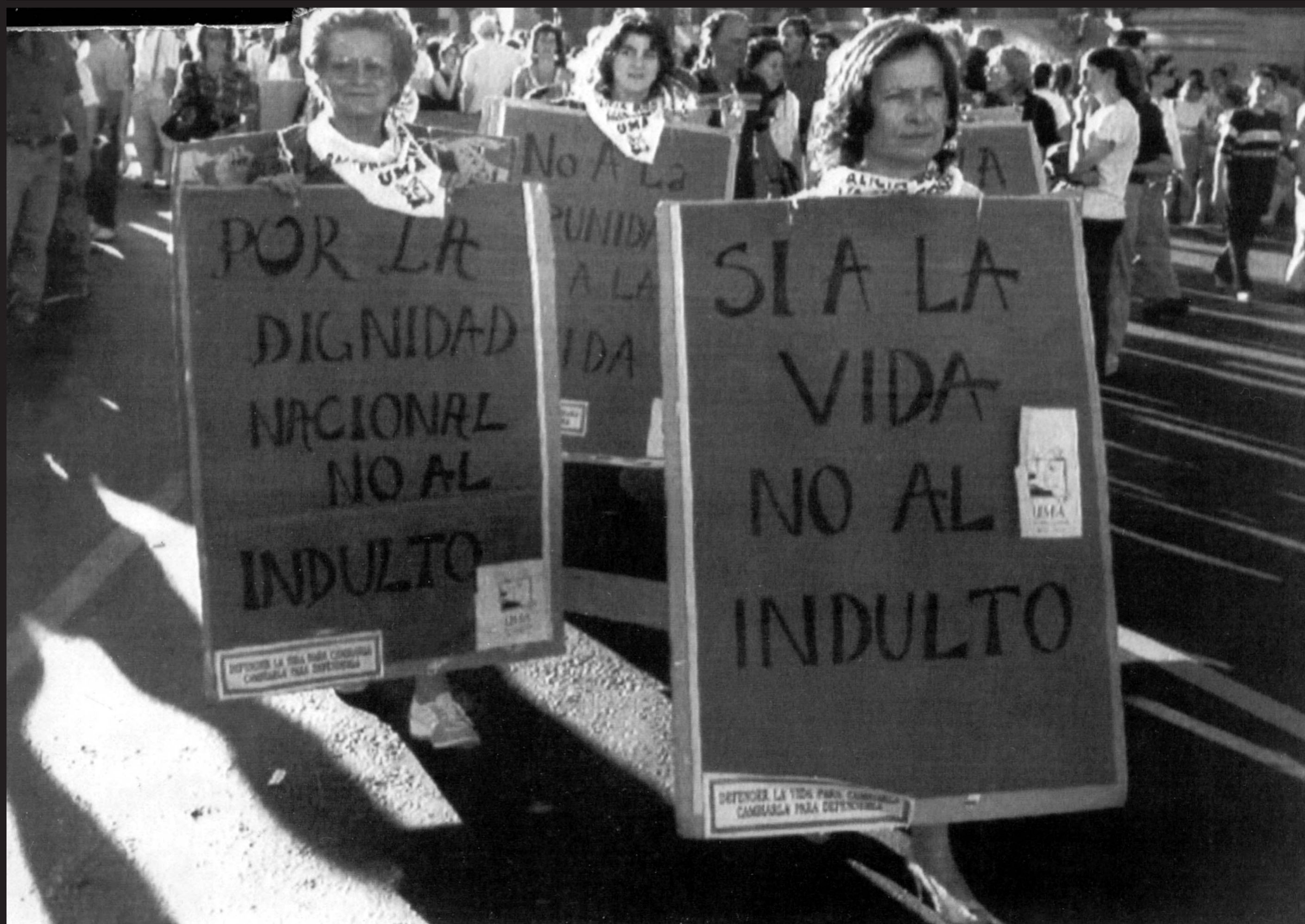
Marcha contra el indulto. 30 de diciembre de 1990.