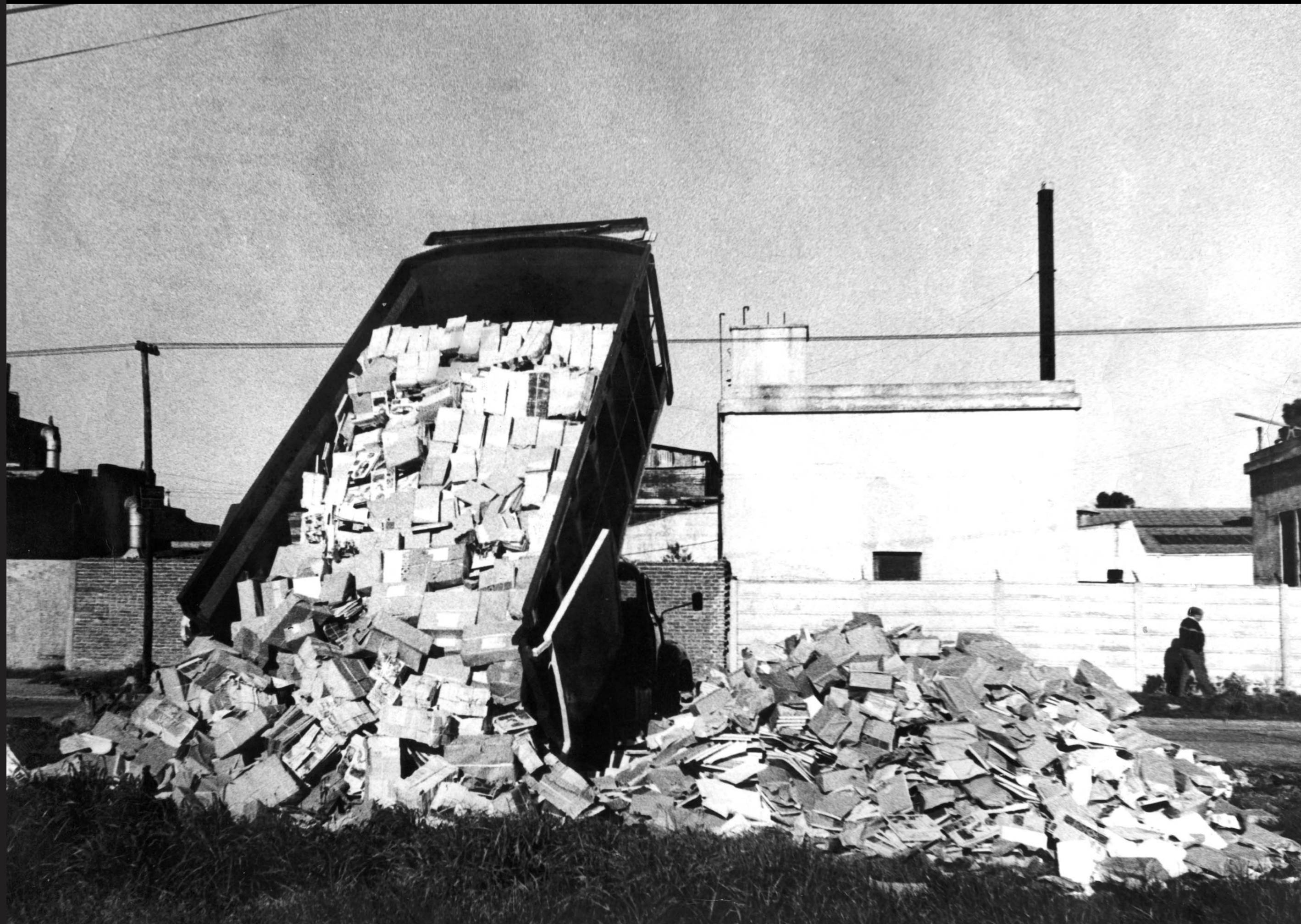
Quema de libros prohibidos y secuestrados durante la dictadura.