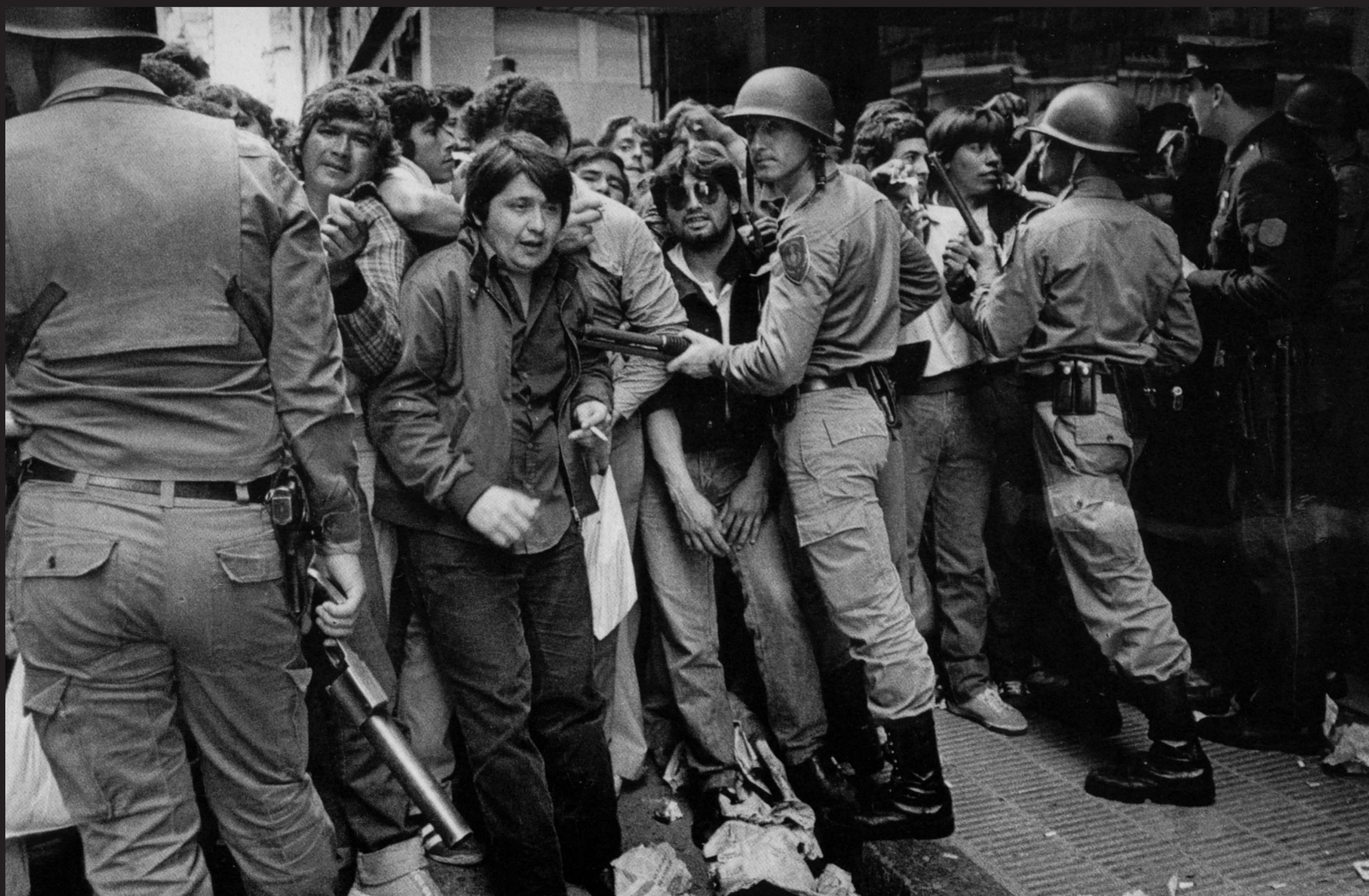
Ciudadanos esperan su documento para poder votar. 30 de octubre de 1983.