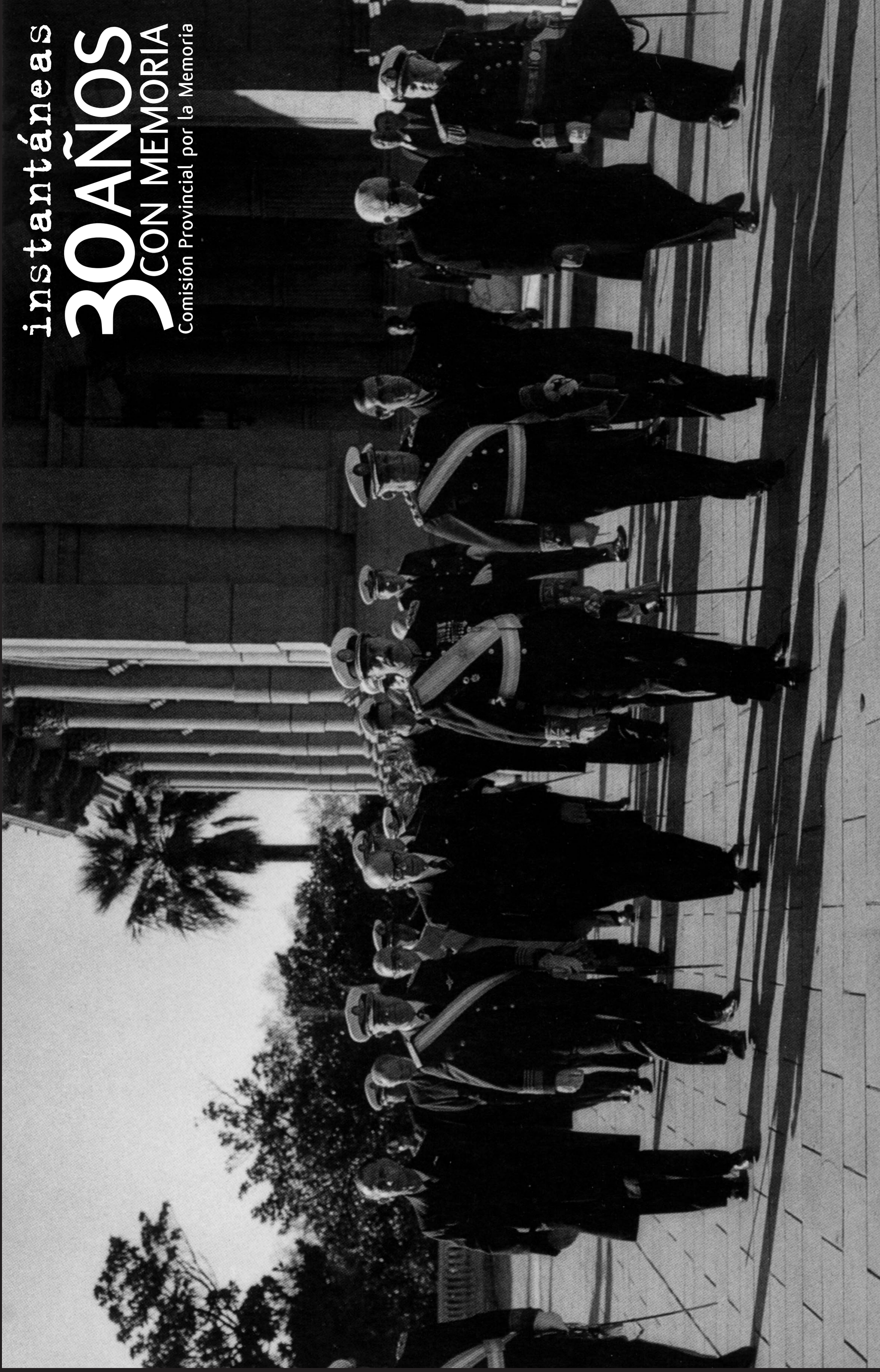
Jorge Rafael Videla. Caminata con su gabinete a la Catedral. Golpe de Estado. Año 1976.