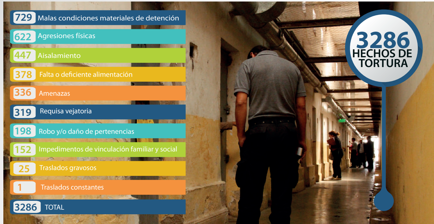
Respuesta múltiple. Base: 3286 hechos descriptos de tortura y/o malos tratos.

Durante el año 2016 se registraron un total de 1265 víctimas que nos permiten la individualización de un total de 3286 hechos de tortura y/o malos tratos. El 93,6% de las víctimas relevadas fueron varones, de las que 7 de cada 10 eran menores de 35 años.