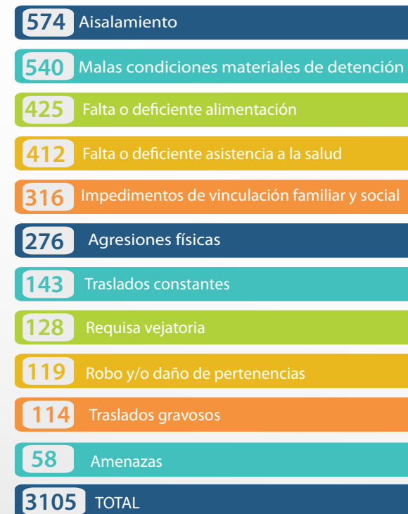
Base: 3.105 hechos descriptos de tortura y/o malos tratos. Fuente: 688 casos del RNCT, GESPyDH-CPM 2016.

Atendiendo a los hechos de torturas y/o malos tratos descriptos por las víctimas, su distribución es la siguiente: