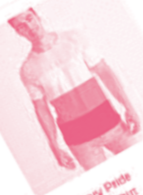
Non Binary Pride Flag Men T-Shirt

Cuando escuchas que “la sexualidad se limita sólo a la genitalidad”