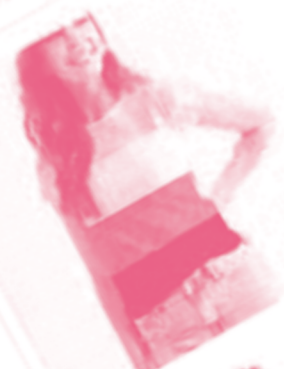
Non Binary Pride Flag Women T-Shirt

-Quiero esa camiseta con la bandera de sexo no binario, por favor. -Estupendo, ¿la quiere de mujer o de hombre?