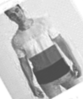
Non Binary Pride Flag Men T-Shirt