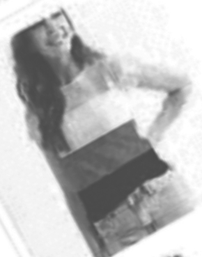
Non Binary Pride Flag Women T-Shirt

-Quiero esa camiseta con la bandera de sexo no binario, por favor. -Estupendo, ¿la quiere de mujer o de hombre?