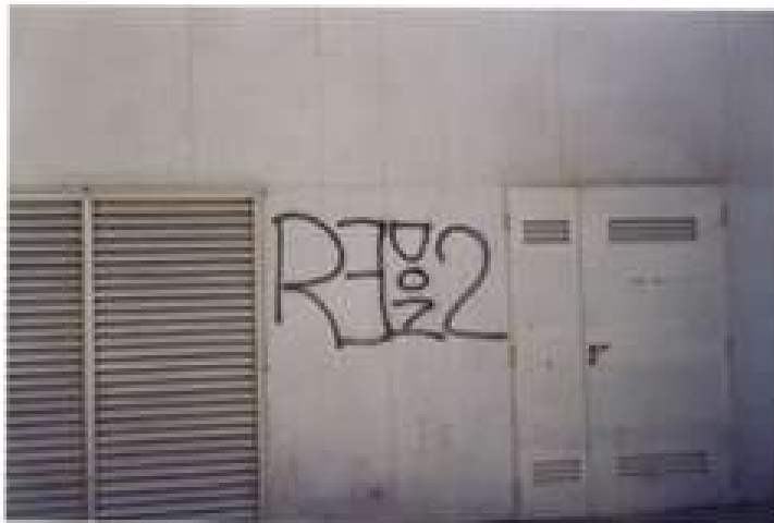
FOTO 12) Edificio de "CASA TIA" por calle Matern (entre Belgrano y San Martín).-