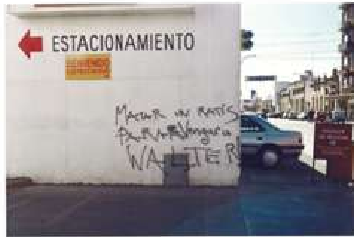
FOTO 2: Escrito sobre la entrada al estacionamiento de // "CASA 713" calle Maroto esquina Belgrano.-