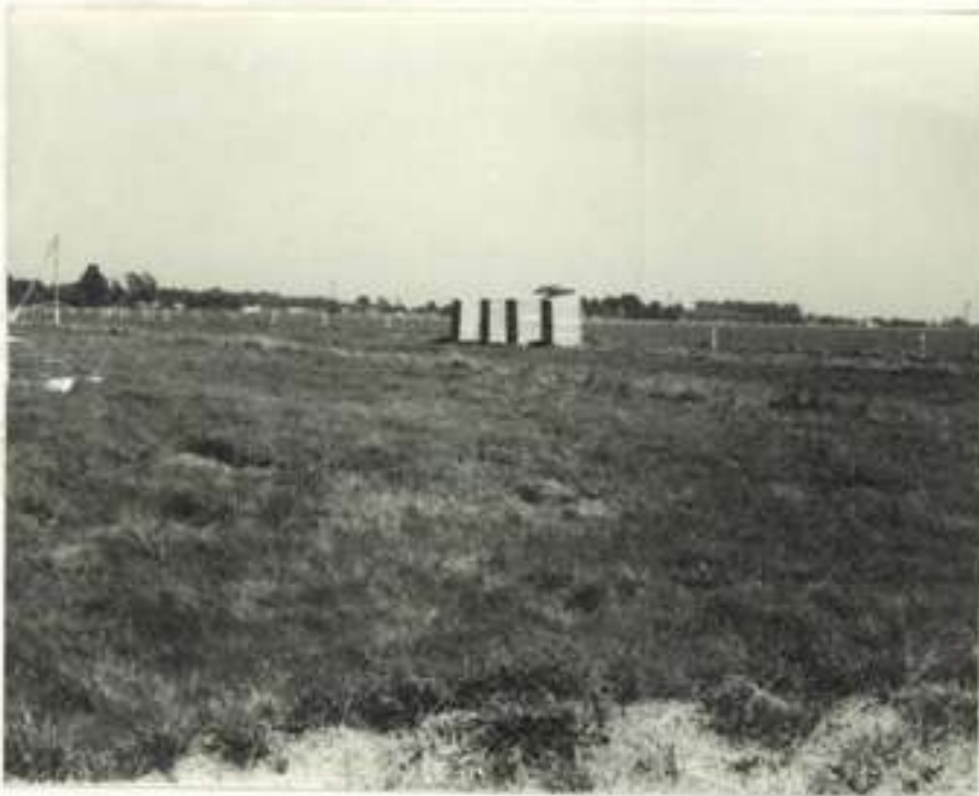
"Apreciación baños emergencia (a distancia)"