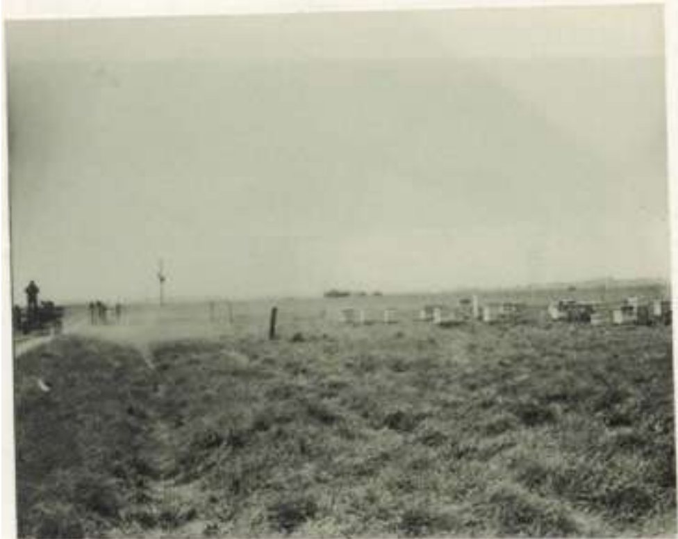
"Apreciación de la entrada al campo "