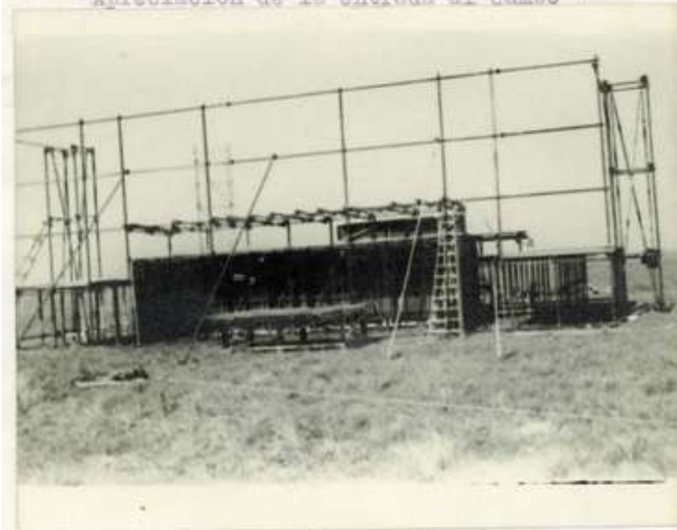
"Apreciación instalación palco oficial (distancia)".