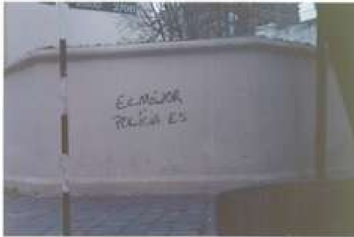
FOTO 1: Detalle sobre la esquina de calles Alaina y // Coronel Suarez.-