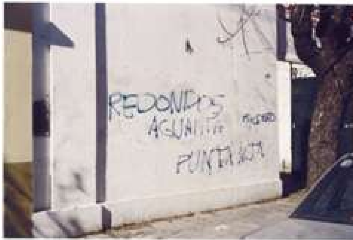
FOTO 5: Calle Rivadavia n° 3248 (entre Epta. Ochoa y 8. / - Barra)