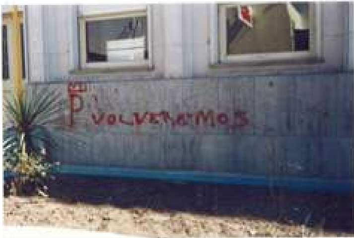
FOTO 11) Lateral del Edificio de la Municipalidad por calle Rivadavia (entre Belgrano y San Martín).-