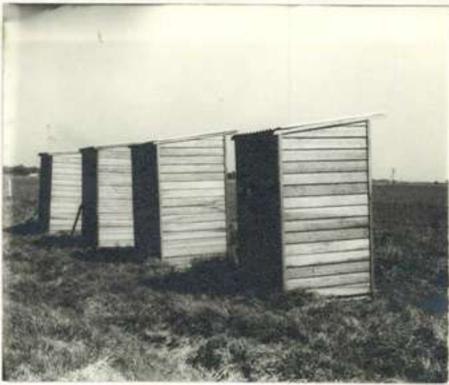
"Apreciación instalación baños emergencia (a corta distancia) "